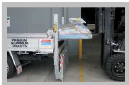
Le hayon permet le chargement des marchandises à l'arrière du caisson